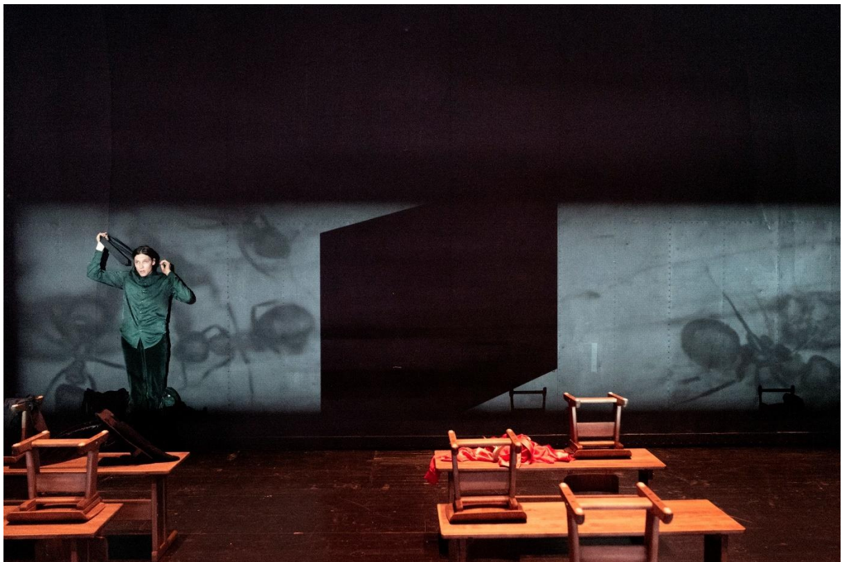
Marius Huth