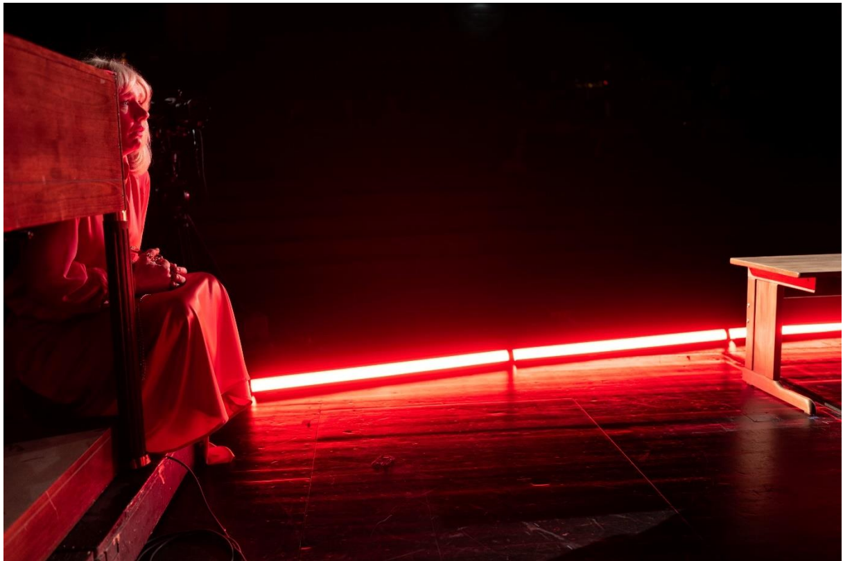
Sandra Hüller