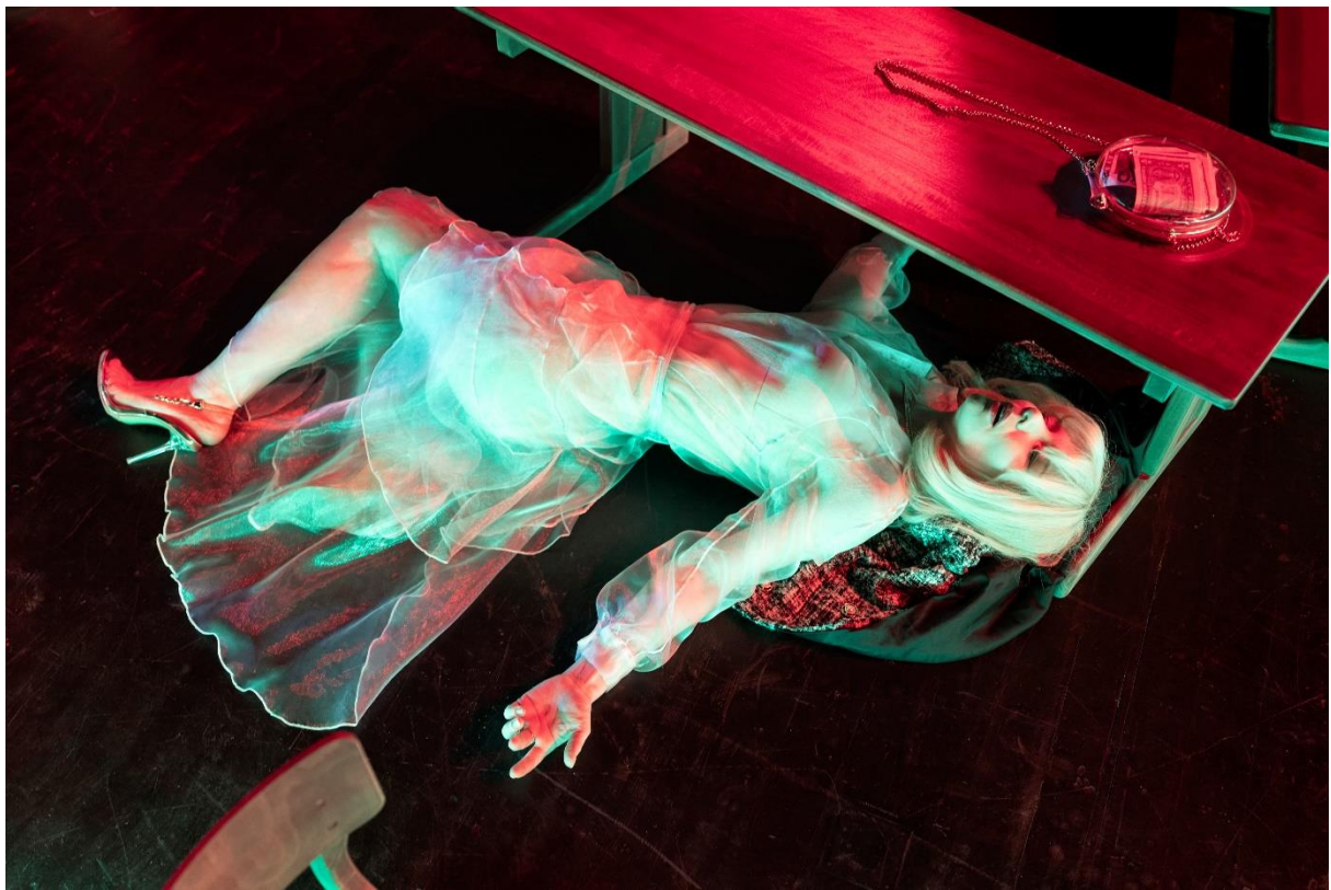
Sandra Hüller © Armin Smailovic