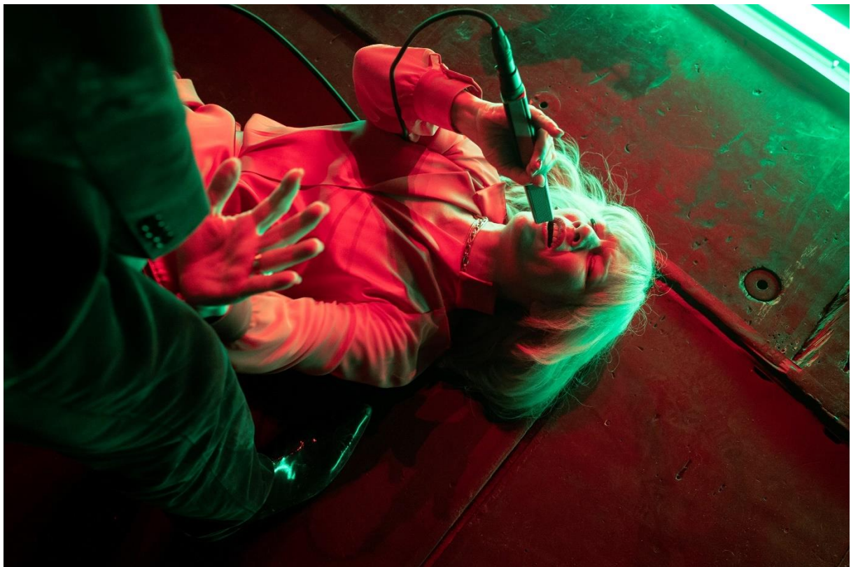
Sandra Hüller © Armin Smailovic