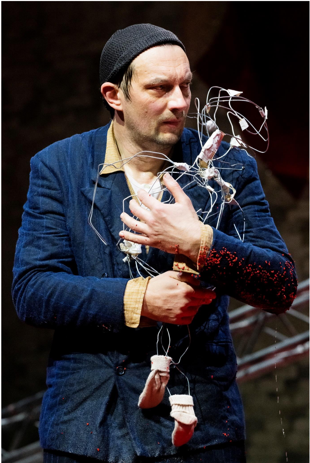
Steven Scharf