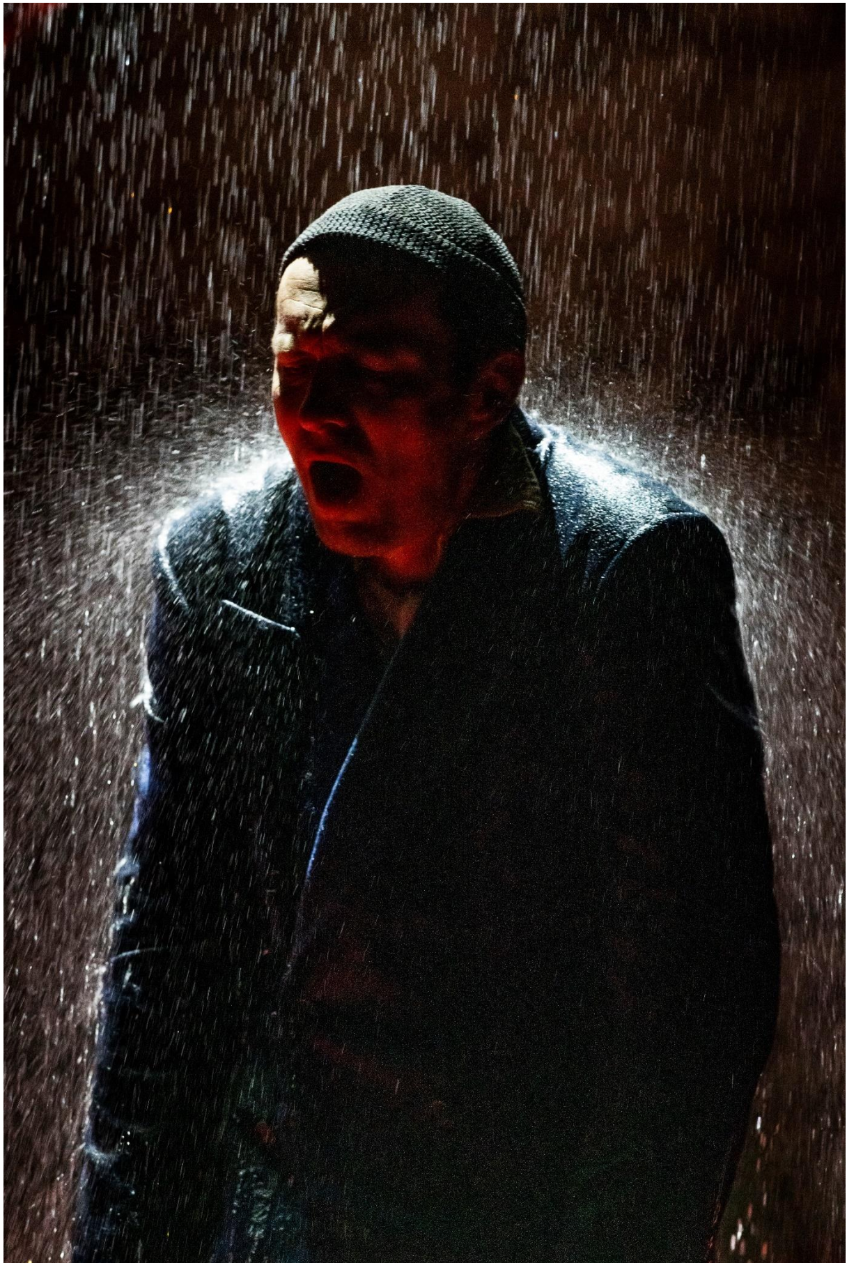
Steven Scharf