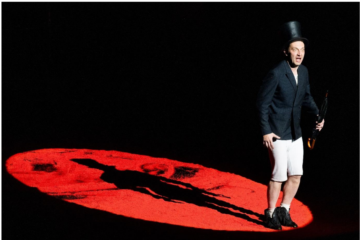
Steven Scharf