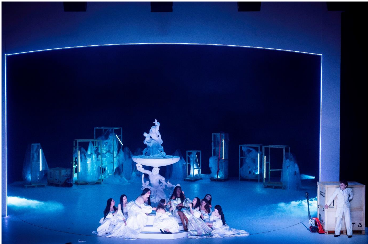
Die Räuber