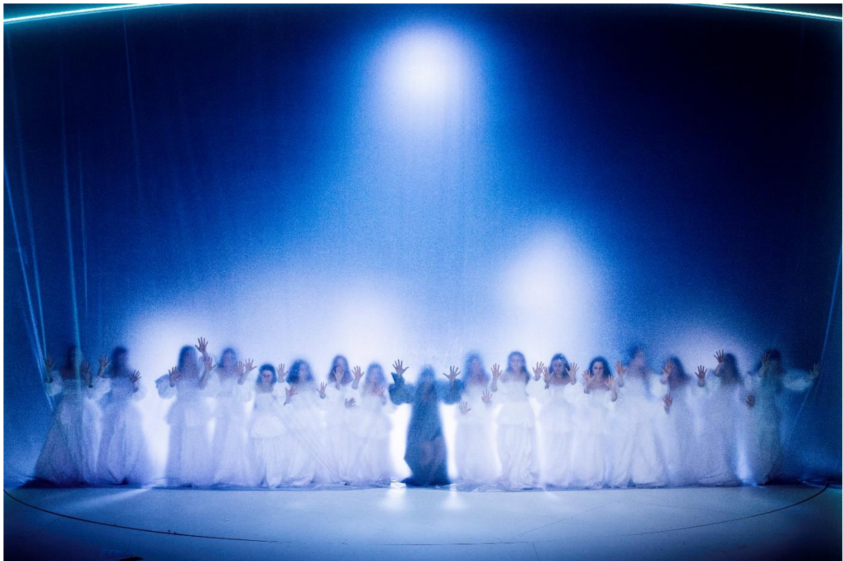
Die Räuber