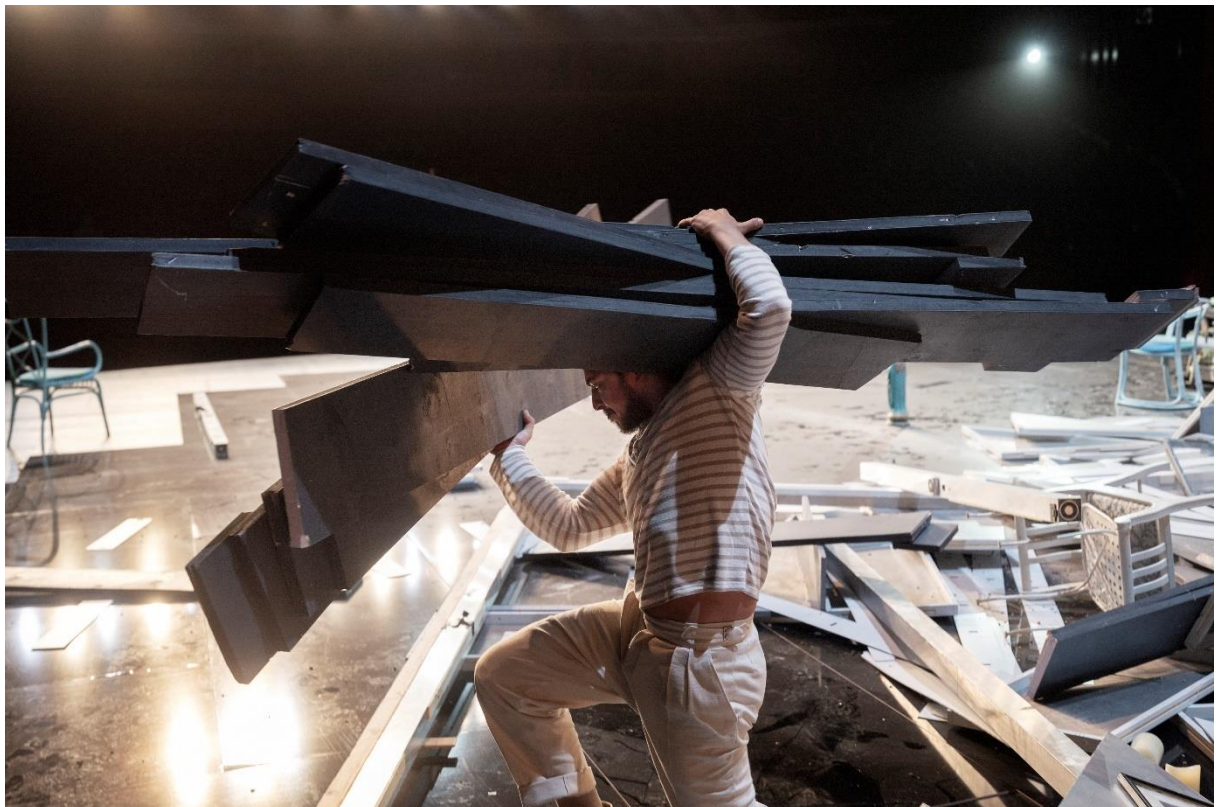
Alexander Wertmann