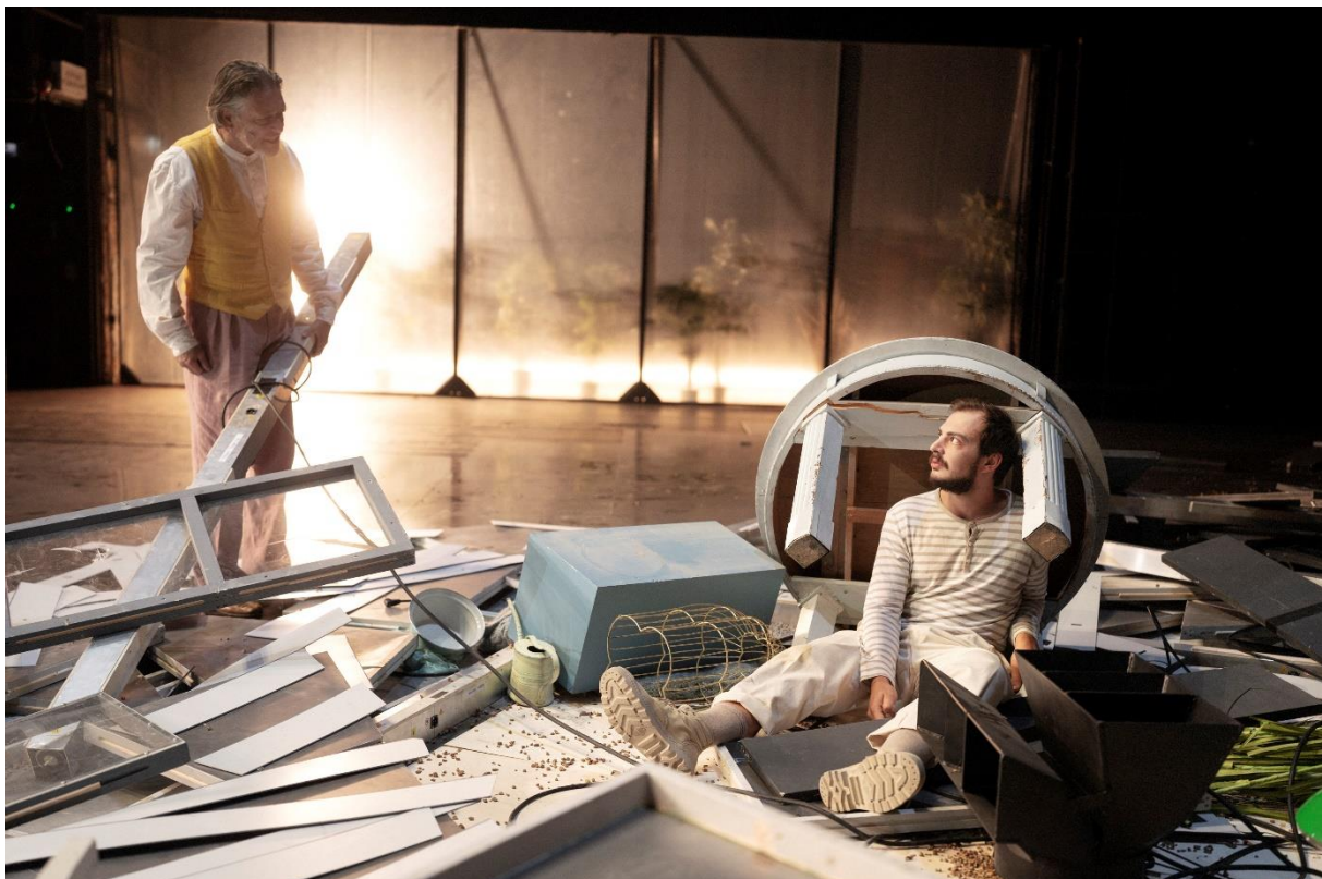
Pierre Bokma, Alexander Wertmann (v. li.)