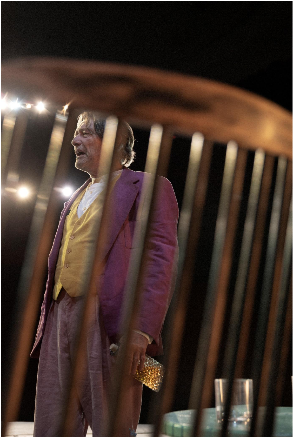
Pierre Bokma © Armin Smailovic